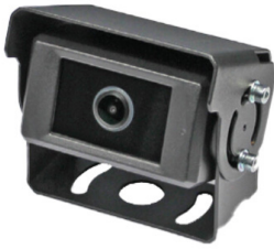
Artikel: CAM150ETH/M12/P1019 Artikelnummer: PER2244