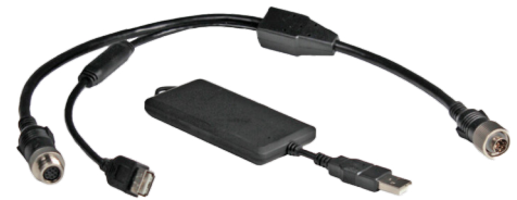
Artikel: KI Kalibrierset / P1024 Artikelnummer: PER2253