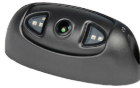
Artikel: CAM170ETH/M12/P1020 Artikelnummer: PER2245