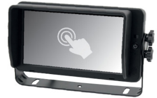
Artikel: MLS-73-HD/P1021 Artikelnummer: PER2247