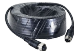
Artikel: KL-410-HD/P1022 Artikelnummer: PER2248